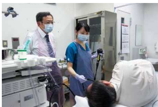
(大塚病院 内科研修風景 (内視鏡))