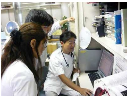
(大久保病院 院内研修風景)