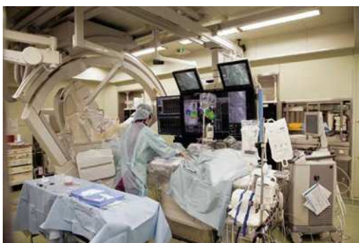
(広尾病院 研修風景 (心臓カテーテル))

専門施設として包括的てんかん診療の研修を行います。脳神経内科、脳神経外科、神経小児科、神経精神科にてんかん専門医が在籍し、てんかん治療総合センターの一員として、長時間ビデオ脳波モニタリングや手術適応症例を経験します。隣接の都立多摩総合医療センターからの critical care EEG のコンサルトで重積例も多く経験できます。2) 脳波報告書作成をハンズオンで指導する他、脳波カンファレンス、てんかん board、てんかん診療連絡協議会を通して専門医としての包括的な姿勢を身につけます。3) 神経病院の将来を支える人材としての自覚を持ち、若手医師の教育や多職種チーム活動、病院運営などに関わります。