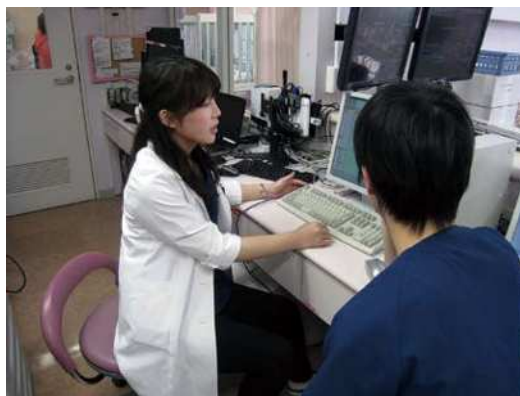
(多摩北部医療センター 研修風景)